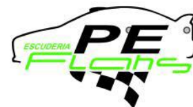
TABLA DE BRIDAS Y PESOS CLASES 6 Y 7 BRIDAS